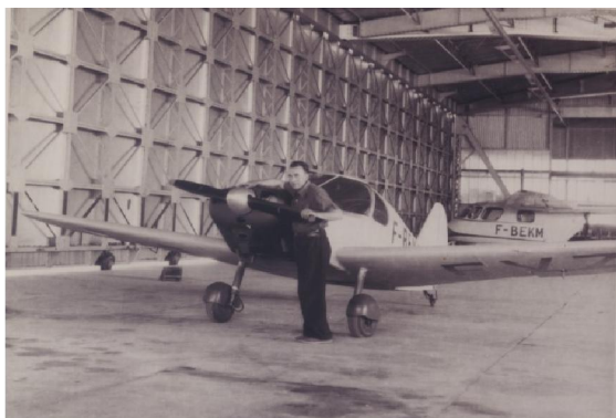
Fabrication Minicab Gardan en 1952