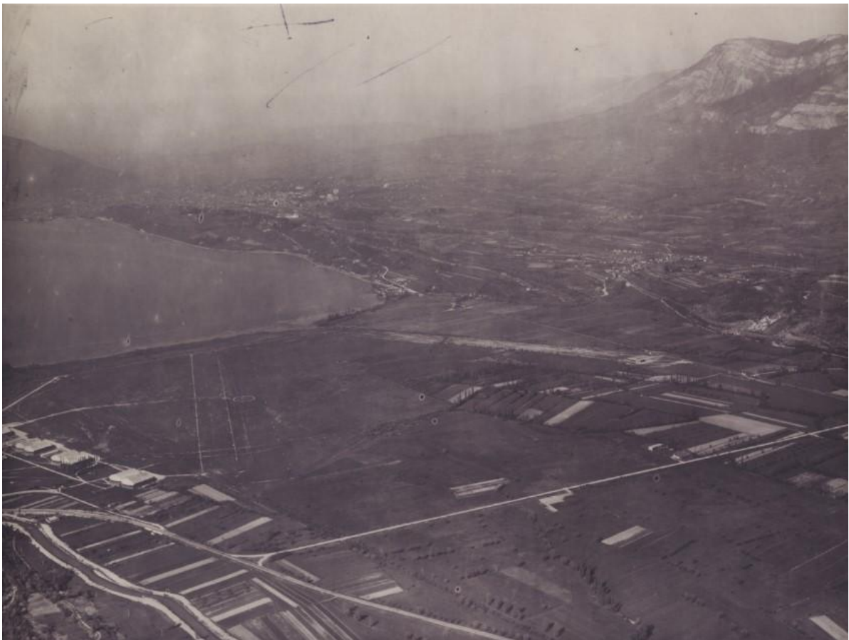
Cette photo date du début des années 50. A gauche, les hangars d'aviation de la base aérienne, avec sur la droite, l'aire gazonnée et balisée qui sert pour les décollage et atterrissages des appareils militaires de liaison qui desservent la base aérienne ; sur le côté droit, la piste dite 'de Chambéry-Voglans' et à son extrémité sud le hangar de la CADAF.

A proximité de ce hangar, se situe la piste dite 'de Chambéry-Voglans', orientée sud-sud-est/nord-nord-ouest, construite probablement avant la Seconde Guerre mondiale. En 1949, l'Aéro-club de Savoie se voit confier officiellement le gardiennage de la piste dite 'de Chambéry-Voglans'. Restée en service jusqu'en 1963, elle se situait au bord de la route nationale 201 entre Aix-les-Bains et Chambéry. Elle est encore visible, en 2018, entre le rond point d'Intermarché et celui de l'aéroport. Les vestiges de cette piste situés dans les terrains délaissés de l'aéroport se trouvent au milieu d'une végétation dense et servent d'accueil pour les gens du voyage.