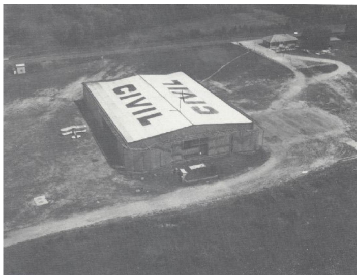
Le Hangar de la CADAF