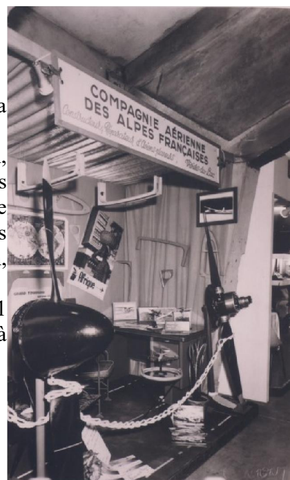
Le stand de la CADAF à la Foire de Chambéry