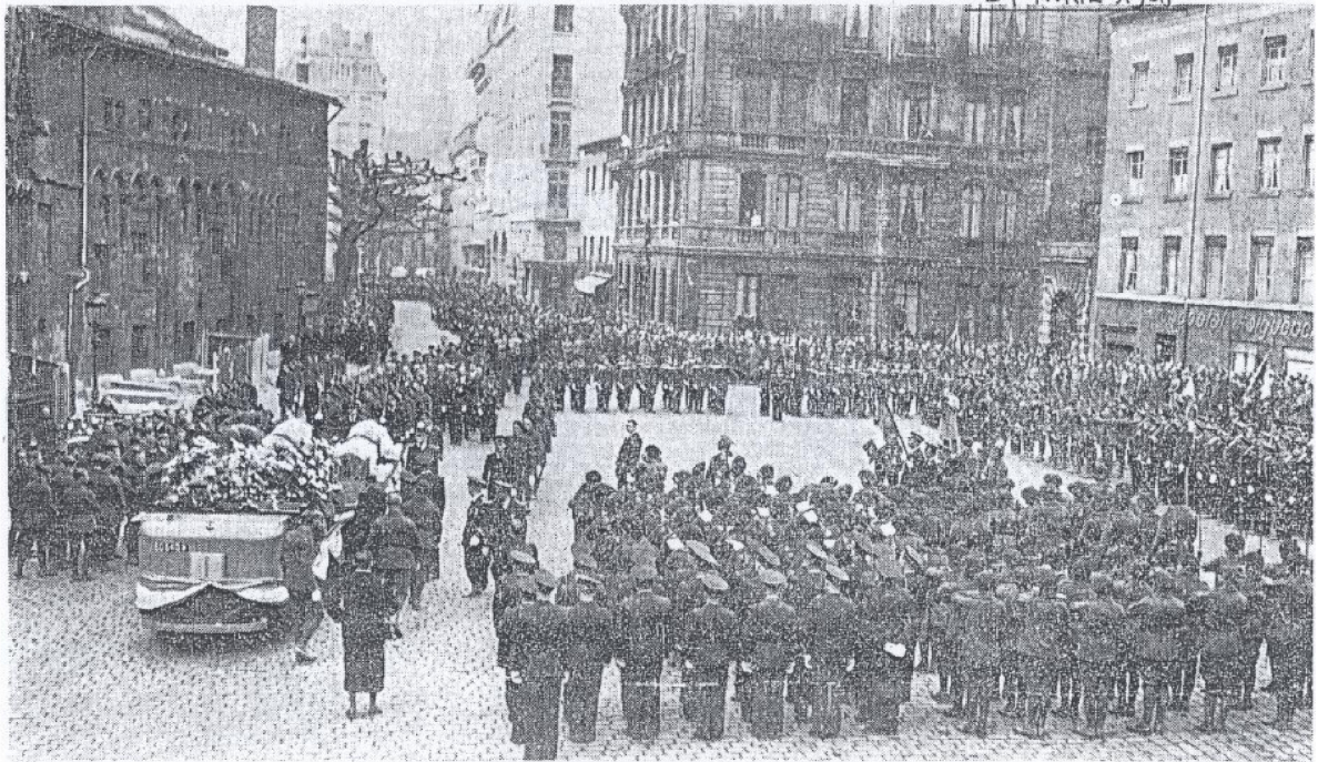
Place Saint-Jean. — Le tracteur arrivant à la Primatiale avec la plateforme portant les cinq cercueils, devant les détachements de la base aérienne, en carré d'honneur. (Lire le compte rendu des obsèques en page 2)