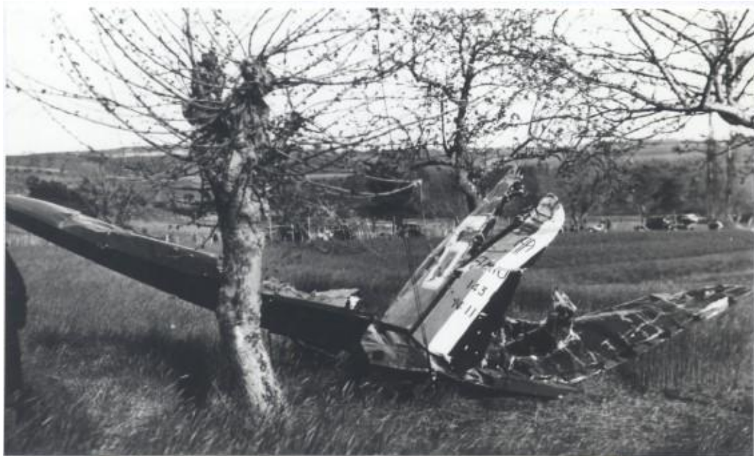
Vue du gouvernail de l'Amiot 143 n°112

D'après la presse de l'époque : «Vers 8h 45, deux appareils à peine visibles dans le ciel survolent la région située entre Saint Vallier et Sait Donat dans la Drôme. Puis, cinq minutes après, un autre appareil surgit à très basse altitude au-dessus des collines de Bathernay. Moteurs fortement emballés et pétaradants, l'appareil se dirige à grande vitesse vers le vallon dit 'le Perdriolon' où se rejoignent les communes de Saint Donat, Charmes et Bathernay. Puis, tout à coup une forte déflagration qui disperse jusqu'à 1 kilomètre de distance des éléments d'ailes, d'empennage, de roues, etc... La partie la plus importante de l'appareil pique vers le sol et s'écrase en déclenchant un immense brasier. Il faut attendre une bonne heure pour s'approcher des restes fumants dans lesquels sont emprisonnés les corps des cinq membres d'équipage de l'Amiot 143 n° 112 -codé 6- dans l'escadrille appartenant à la 35 ème Escadre. La Commission d'enquête envisage comme conclusion de cet accident, que l'appareil s'est disloqué lors d'une forte 'ressource'. Le pilote pris dans un épais nuage a-t-il voulu se dégager en piquant vers le sol, puis surpris par la proximité du relief, il aurait exécuté une 'ressource' qui s'est avérée trop violente et qui a entraîné la désintégration en vol de l'appareil, ce qui explique la déflagration entendue par les témoins»