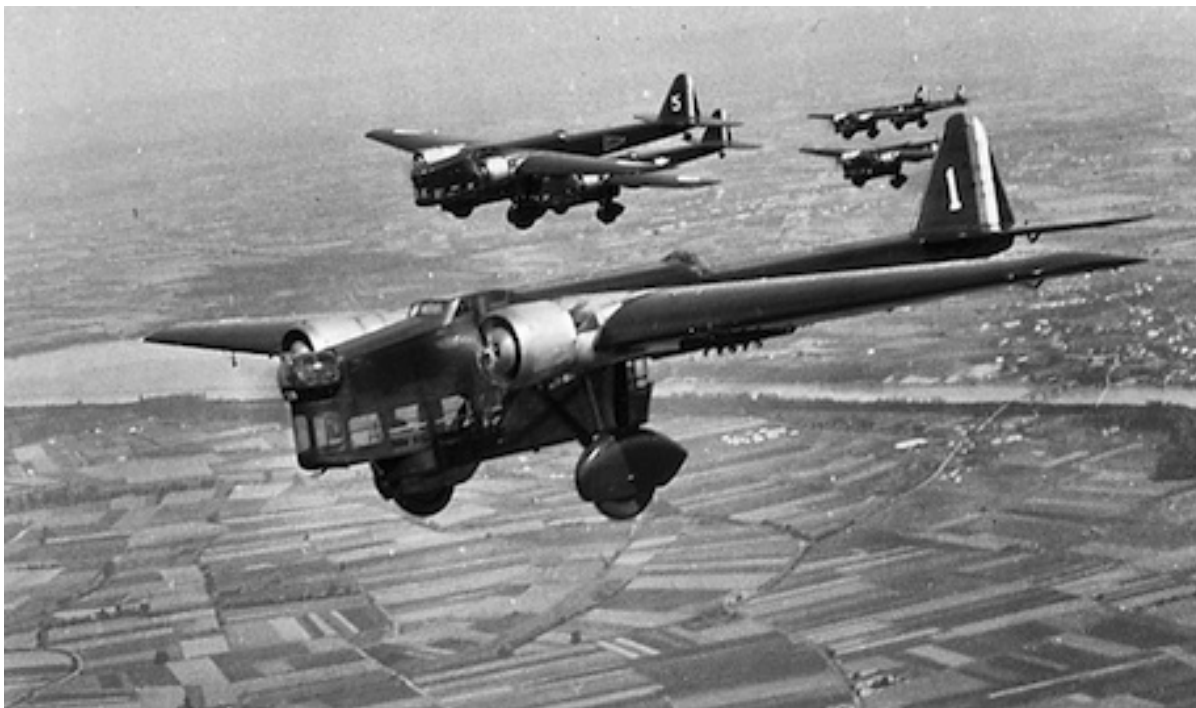
Amiot 143 en vol