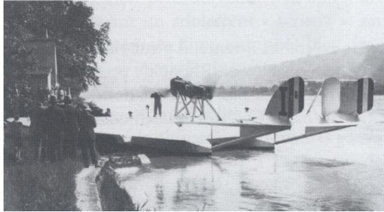
Fig. 4 : L'hydravion vu de l'arrière, à proximité du café Guigal, sur la rive droite du Rhône, [Collection privée].

Documents photographiques provenant de l'ouvrage de M. Hullo 'Vienne, un hydravion italien sur le Rhône' publié dans le n°112 de l'année 2017 de la Société des Amis de Vienne