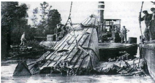
La Vallée du Rhône : témoin de la tragédie du dirigeable 'Italia'